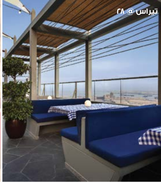
تيراس @ ٢٨